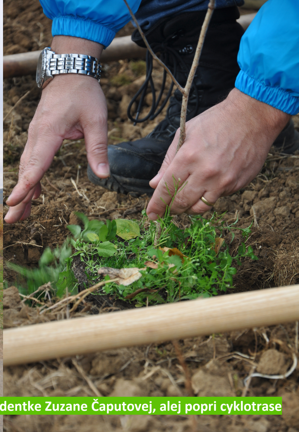
Otvorenie iniciatívy v Trstenom pri Hornáde - škôlka stromov venovaná prezidentke Zuzane Čaputovej, alej popri cyklotrase